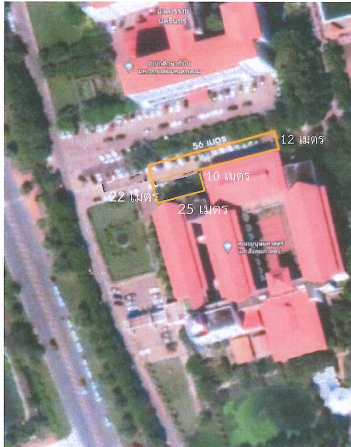
ผังบริเวณก่อสร้างอาคารเพิ่มเติม (ลานจอดรถยนต์ฝั่งคณะมนุษยศาสตร์ฯ)