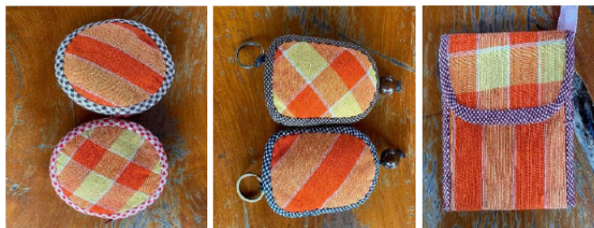
ภาพที่ 3 ผลิตภัณฑ์ต้นแบบประเภทกระเป๋าผ้า