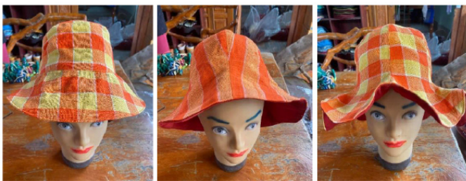
ภาพที่ 2 ผลิตภัณฑ์ต้นแบบประเภทหมวกผ้า

2.3.1 ผลิตภัณฑ์ประเภทหมวก จากการวิจัยได้สร้างผลิตภัณฑ์ต้นแบบประเภทหมวก 3 รูปแบบ ได้แก่ 1) หมวกทรงบักเกต 2) หมวกทรงทิวลิป และ 3) หมวกทรงดอกไม้