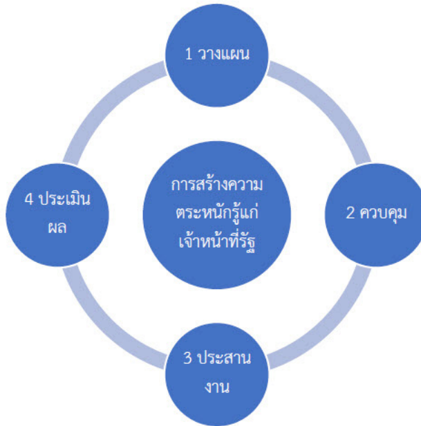
ภาพที่ 3 หลักการสร้างความตระหนักรู้ของเจ้าหน้าที่รัฐต่อการบริหารราชการบ้านเมืองที่ดี ที่มา: พนารัตน์ มาศมมาตล

เป้าหมายที่กำหนดรวมทั้งเป็นที่พึงพอใจแก่ประชาชน สอดคล้องกับหลักการและรูปแบบการบริหารของ ก.พ.ร. ที่มุ่งเน้นให้ส่วนราชการบริหารงานบุคคลและให้บริการประชาชนด้วยหลักเกณฑ์ที่ดี โดยเสนอเป็นรูปแบบดังภาพที่ 3 ดังนี้