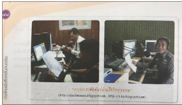
ภาพที่ 4 เครื่องช่วยประกอบเนื้อหา หลักสูตรปีพุทธศักราช 2557

ที่มา: เรืองอุไร อินทรประเสริฐ และคณะ. (2560: หน้า 78). ภาษาไทยเพื่อสื่อสารในงานอาชีพ. กรุงเทพฯ: ศูนย์ส่งเสริมวิชาการ.