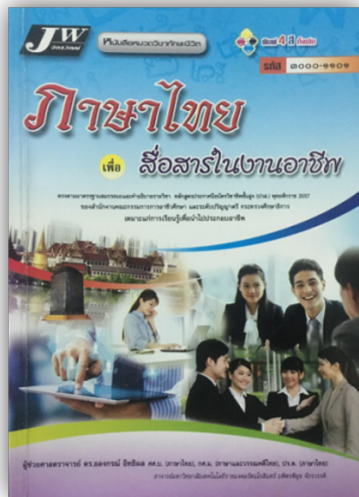
ภาพที่ 4 ภาพประกอบหน้าปกที่มีลักษณะเด่น หลักสูตรปีพุทธศักราช 2557

ที่มา: อลงกรณ์ อิทธิพล. (2558: หน้าปก). ภาษาไทยเพื่อสื่อสารในงานอาชีพ. กรุงเทพฯ: จิตรวัฒน์.