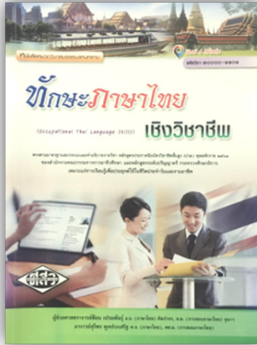
ภาพที่ 5 ภาพประกอบหน้าปกที่มีลักษณะเด่น หลักสูตรปีพุทธศักราช 2563 ที่มา: สุรียพร พูลประเสริฐ. (2563: หน้าปก). ทักษะภาษาไทยเชิงวิชาชีพ. กรุงเทพฯ: ศูนย์ส่งเสริม วิชาการ.

4.1 ลักษณะเด่นของหน้าปกหนังสือเรียนทักษะภาษาไทยเชิงวิชาชีพ ได้แก่ ภาพประกอบหน้าปกการสื่อสารที่สัมพันธ์กับเอกลักษณ์ไทยภาพประกอบหน้าปกที่เกี่ยวกับการประชาสัมพันธ์ และภาพประกอบหน้าปกที่เกี่ยวกับการสื่อสารเชิงวิชาชีพ เช่น หนังสือที่เรียบเรียงโดยอมรรัตน์ ฉายศรี พบว่าลักษณะเด่นของภาพหน้าปกเป็นการใช้รูปภาพเกี่ยวกับการสื่อสารทางธุรกิจหรือเชิงวิชาชีพ เพราะในหลักสูตรนี้มุ่งเน้นที่จะพัฒนาให้ผู้เรียนหรือนักศึกษาเกิดทักษะของการสื่อสารในเชิงธุรกิจหรือเชิงวิชาชีพได้อย่างมีประสิทธิภาพ