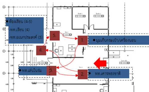
ภาพที่ 2 พื้นที่การใช้งาน และลำดับการเข้าใช้งาน ศูนย์พัฒนาเด็กเล็กบ้านดอนนา

ส่งเสริมการปกครองส่วนท้องถิ่น ลักษณะกิจกรรมการเรียนรู้ ประกอบไปด้วย 1. กิจกรรมเดี่ยวแบบอิสระ ได้แก่ กิจกรรมเก็บของเครื่องใช้ส่วนตัว กิจกรรมเล่น ปูที่นอน วาดภาพระบายสี เป็นต้น 2. กิจกรรมเดี่ยวแบบคุณครูนำ ได้แก่ เคารพธงชาติ การเรียนรู้ร่างกาย และ 3. กิจกรรมกลุ่ม ได้แก่ เคารพธงชาติ สวดมนต์ทำสมาธิ และกิจกรรมการเรียนรู้ต่าง ๆ