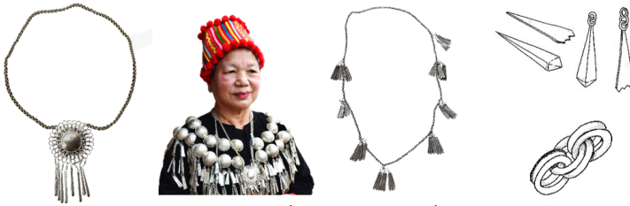
ภาพที่ 6 สร้อยคอของชนเผ่าคะฉิ่น ที่มา: ภาพถ่ายโดยผู้เขียน วันที่ 2 กุมภาพันธ์ พ.ศ. 2563

2. สร้อยคอ สร้อยคอของชนเผ่าคะฉิ่นเป็นลักษณะเส้นสร้อยที่เกิดจากการถัก แล้วมีตัวเรือนและชิ้นส่วนประกอบอยู่ แบบที่ 1 มีตัวเรือนรูปคล้ายดอกไม้และพวงระย้า ประกอบ แบบที่ 2 มีพวงระย้าติดที่เส้นสร้อย 5-8 ชุด แต่ละชุดห่างกัน มีพวงระย้าห้อย รวมกัน 5-8 ชิ้น แบบที่ 2 พวงระย้าที่ห้อยอยู่จะเกิดเสียงดังที่เกิดจากการกระทบกันของแต่ละชิ้นส่วน สร้อยคอของชนเผ่าคะฉิ่นนิยมสวมใส่ร่วมกับเสื้อประจำเผ่า ความสวยงามของสร้อยคองานนี้ อยู่ที่ความประณีตของรูปทรงดอกไม้ ที่ใช้วิธีการม้วนเส้นลวดให้มีความสมดุลกัน และจังหวะของการวางพวงระย้า แสดงดังภาพที่ 6