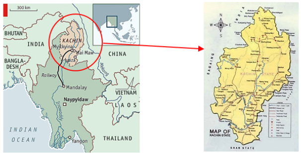
ภาพที่ 1 แผนที่รัฐคะฉิ่นในประเทศเมียนมาร์ ซึ่งเป็นพื้นที่อาศัยที่สำคัญแห่งหนึ่งของชนเผ่าคะฉิ่น

มองโกเลียผ่านประเทศจีนแล้วมาอาศัยอยู่ใน 4 แห่งคือ บริเวณตอนเหนือของประเทศเมียนมาร์ในรัฐคะฉิ่น มณฑลยูนนานของประเทศจีน รัฐอัสสัมของประเทศอินเดีย และบางส่วนได้ย้ายถิ่นฐานลงมาทางรัฐฉานของประเทศเมียนมาร์ จนถึงทางทิศเหนือของประเทศไทย คนเผ่าคะฉิ่นในประเทศไทยนั้นแต่เดิมได้อาศัยอยู่ร่วมกับชนเผ่าอื่น เช่น ชนเผ่าลาหู่ ลีซู อาข่า กะเหรี่ยง ม้ง ฯลฯ เป็นต้น ก่อนหน้านั้นชนเผ่าคะฉิ่นอาศัยอยู่ร่วมกับชนเผ่าอื่นในหมู่บ้านต่าง ๆ ของจังหวัดเชียงใหม่ เชียงราย และแม่ฮ่องสอน ต่อมาได้มีการรวมตัวกันเป็นชุมชนคะฉิ่นในหมู่บ้านใหม่สามัคคี ชนเผ่าคะฉิ่นที่หมู่บ้านแห่งนี้ เรียกตัวเองว่า จิงเพาะ อาจเขียนว่า จิงเพาะ หรือ จิงเปาะ (Jinghpaw) หรือ วุ่นปอง (Wunpawng) โดยที่ อนุชาติ ลาพา (2562: สัมภาษณ์) ประธานกลุ่มท่องเที่ยวเชิงวัฒนธรรมของชนเผ่าคะฉิ่น บ้านใหม่สามัคคี ได้อธิบายว่า ชนเผ่าคะฉิ่นจำแนกออกเป็นกลุ่มย่อย 6 กลุ่มคือ 1) จิงเพาะ (Jinghpaw) 2) มาหู่ หรือลองว่อ (Maru , Lawngwaw) 3) ระวาง (Rawang) 4) ลีซู (Lisu) 5) ละชี หรือละชิก (Lashi , Lachik) และ 6) ไชว้าหรืออะซี (Zaiwa, Ahzi) บ้านใหม่สามัคคี มีชนเผ่าคะฉิ่นทั้ง 6 กลุ่มอาศัยอยู่ร่วมกัน แต่ละกลุ่มมีวิถีชีวิตและวัฒนธรรมที่คล้ายคลึงกัน คะฉิ่นกลุ่มจิงเพาะมีจำนวนประชากรอาศัยมากกว่าทุกกลุ่ม ส่วนการติดต่อสื่อสารนั้นใช้ภาษาของคะฉิ่นกลุ่มจิงเพาะเป็นภาษากลางในการติดต่อสื่อสาร