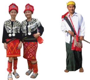
ภาพที่ 3 ภาพชายคือนชนเผ่าคะฉิ่น 6 กลุ่มย่อย ภาพกลางและขวาคือนชนเผ่าคะฉิ่นกลุ่มจิงเผาะ