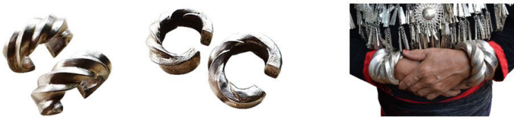
ภาพที่ 7 กำไลข้อมือของชนเผ่าคะฉิ่น วันที่ 2 กุมภาพันธ์ พ.ศ. 2563

3. กำไลข้อมือเป็นกำไลก้านเปิด รูปทรงคล้ายเกลียวเชือกหรือฟันเฟือง ทำจากโลหะเงินทึบตัน มีน้ำหนักมาก มีขนาดเส้นผ่านศูนย์กลางไม่น้อยกว่า 6 เซนติเมตร ภายในวงของกำไลส่วนใหญ่เป็นรูปวงรี เพื่อต้องการให้เข้ากับสัดส่วนของข้อมือ ซึ่งมีหน้าตัดของวงเป็นรูปวงรี เมื่อต้องการสวมกำไลนี้ จะต้องเอียงข้อมือเข้าทางด้านข้าง เนื่องจากช่องว่างของก้านกำไลมีขนาดแคบ ความสวยงามของกำไลนี้อยู่ที่พื้นผิวนอกกำไล ซึ่งคล้ายกับฟันเฟืองหรือเกลียวเชือก ทำให้เกิดมิติ และแสดงถึงความเข้มแข็ง แสดงดังภาพที่ 7