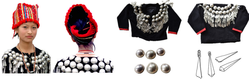
ภาพที่ 8 เม็ดกระดุมประกอบพวงระย้าของชนเผ่าคะฉิ่น ที่มา : ภาพถ่ายและภาพลายเส้นโดยผู้เขียน วันที่ 2 กุมภาพันธ์ พ.ศ. 2563

ไม่น้อยกว่า 20 ชิ้น มองดูคล้ายกับเสื้อเกราะ ส่วนพวงระย้านั้นมีรูปทรงขนาดเล็กคล้ายกับรูปทรงของดอกพวงแสด ร้อยด้วยห่วงติดกับเม็ดกระดุม ทั้งด้านหน้าและด้านหลังเช่นกัน พวงระย้าเหล่านี้เคลื่อนไหวได้และเกิดเสียงดังเมื่อเคลื่อนไหวร่างกาย ความสวยงามของเม็ดกระดุมและพวงระย้า อยู่ที่สีของกระดุมที่ติดกับสีของเสื้อทำให้เกิดความเด่นชัดและเป็นจุดเด่น จังหวะการนำกระดุมมาจัดวางบนเสื้อ ลวดลายบนพื้นผิวกระดุมที่กลมกลืนกับรูปทรงกระดุม และลักษณะการเคลื่อนไหวของพวงระย้า แสดงดังภาพที่ 8