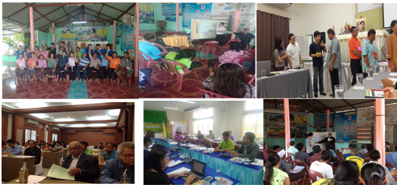
ภาพที่ 2 ประมวลภาพการดำเนินการวิจัย การสัมภาษณ์กลุ่ม (Focus group interview) การจัดระดมสมอง (Brainstorming) กิจกรรมพัฒนาศักยภาพการวิจัย การจัดเวทีปรึกษาหารือสาธารณะ (Public Consultation)

ถิ่น” ณ ศาลาประชาคม บ้านหินปูน ตำบลเขว้าใหญ่ อำเภอกันทรวิชัย จังหวัดมหาสารคาม เป็นเวทีที่ทีมวิจัยร่วมกับหลายภาคส่วน โดยมี สภาเกษตรกรแห่งชาติ อบต. เขว้าใหญ่ กรมประมง กรมเจ้าท่า เครือข่ายเกษตรกรกรมทางเลือกภาคอีสาน ยุติธรรมจังหวัด ร่วมดำเนินการดังกล่าว ณ ศาลาบ้านหินปูน ตำบลเขว้าใหญ่ อำเภอกันทรวิชัย จังหวัดมหาสารคาม มีการให้ความรู้และคำแนะนำจากภาคีเครือข่าย ภาครัฐ สภาเกษตรกรแห่งชาติ อบต. เขว้าใหญ่ กรมประมง กรมเจ้าท่า เครือข่ายเกษตรกรกรมทางเลือกภาคอีสาน ยุติธรรมจังหวัด การเสวนาร่วม การถามตอบ แลกเปลี่ยนความคิดเห็น และเสนอแนวทางการขับเคลื่อนนโยบายต่อยอดในอนาคต 3.2) การถอดบทเรียนสังเคราะห์ข้อมูลที่ได้จากการวิจัย วันที่ 4 ตุลาคม พ.ศ. 2558 “การสร้างกระบวนการเรียนรู้เพื่อนำไปสู่การคุ้มครองสิทธิเกษตรกรผู้เลี้ยงปลากระชังในระบบเกษตรพันธสัญญา” โดยนักวิจัย ร่วมกับศูนย์ส่งเสริมวิชาการเพื่องานวิจัยท้องถิ่น จังหวัดมหาสารคาม (โหนดวิชาการ สกว.) เป็นเวทีการถอดบทเรียนร่วมโดยเกษตรกรและนักวิจัย ร่วมกับภาคีเครือข่ายเพื่อให้ข้อเสนอและร่วมกำหนดนโยบายและแนวทางการขับเคลื่อนนโยบาย