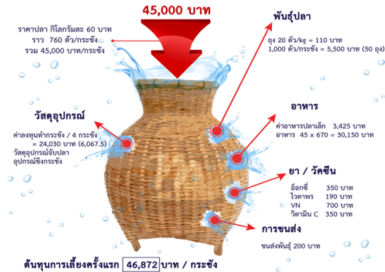
ภาพที่ 2 แสดงต้นทุนในการเลี้ยงปลาระชังในระบบเกษตรพันธสัญญา รายรับ รายจ่าย จากการจัดเวทีระดมสมอง

1.3) ผลกระทบจากการเลี้ยงปลาระชังในระบบเกษตรพันธสัญญา มีผลกระทบดังต่อไปนี้ ผลกระทบด้านเศรษฐกิจ การเลี้ยงปลาระชังนั้น ส่งผลต่อระบบเศรษฐกิจในรูปแบบเศรษฐกิจชุมชนที่มีทั้งแง่บวก ในเชิงรายได้ และแง่ลบในเชิงหนี้สิน ผลกระทบดังกล่าว คือ ความไม่แน่นอนมีอยู่สูงมากในระบบการเลี้ยงปลาของเกษตรกรพันธสัญญา หากการเลี้ยงปลาระชังนั้น สามารถทำได้ตรงตามเป้าหมาย ถือว่าเป็นอาชีพที่สร้างรายได้อย่างทวีคูณ ซึ่งภาพสะท้อน อย่างช่วงอดีตที่มีการเริ่มเลี้ยงใน ปี พ.ศ. 2538 ถึงปลายปี พ.ศ. 2546 ที่การเลี้ยงปลานั้นถือได้ว่าเป็นยุคเฟื่องฟู “ โอ้ว เลี้ยงใหม่ ๆ ปี 38 บ่ธรรมดาเดเองง่าย ๆ ว่า กำไรกับต้นทุน นีหลายสิบเท่าละไป ผมเคยได้หลายแสนในยุคแรกนั้น ก่อนที่สีมาเจอยุคหนึ่ง การเลี้ยงปลาเนี้ คั้นฮ่าได้ กะ หยัดดอก คอซัน ฟุ่นละ เงินเต็มกระเป๋ แต่ฮ่าปลาตายมากะ คอดก จนว่าบ่อยากเงยหน้าฟุ่นละ พ้อมาเทิงสองแบบแล้ว” (ผู้ให้ข้อมูลรายหนึ่ง)