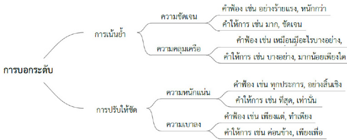
ภาพที่ 3 แสดงระบบการแสดงความหมายของการบอกระดับในการใช้ถ้อยคำในการเขียนคำฟ้องและคำให้การในคดีทางการแพทย์

ผู้วิจัยสามารถสรุปการใช้ถ้อยคำในการเขียนคำฟ้องของโจทก์และคำให้การของจำเลยเป็นระบบของการแสดงความหมายของการบอกระดับ ดังภาพต่อไปนี้