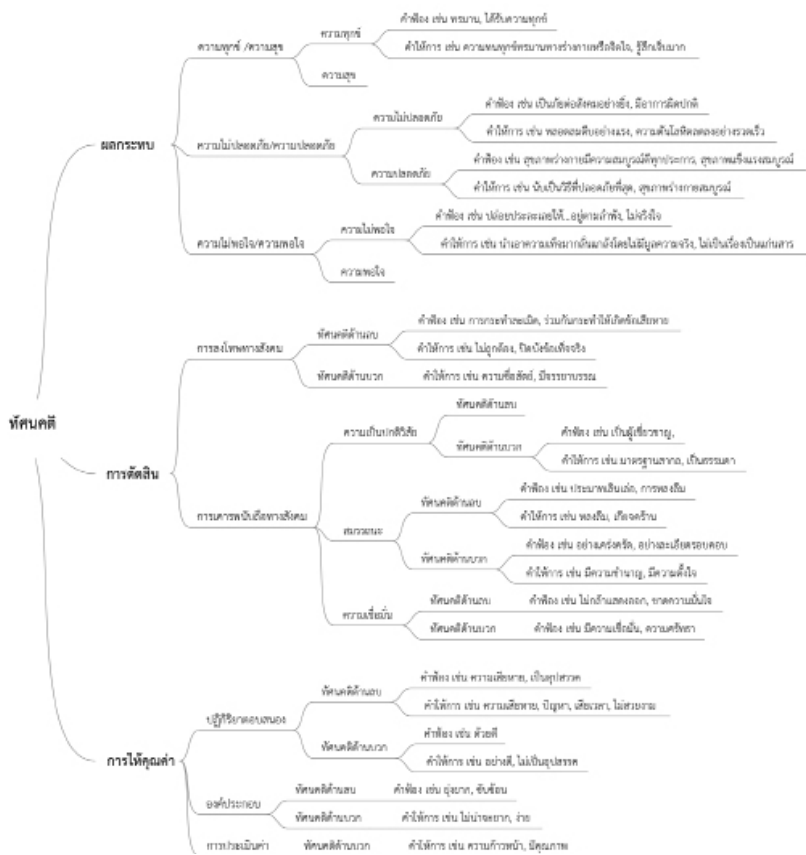
ภาพที่ 2 แสดงระบบการแสดงความหมายของทัศนคติในการใช้ถ้อยคำในการเขียนคำฟ้องและคำให้การในคดีทางการแพทย์