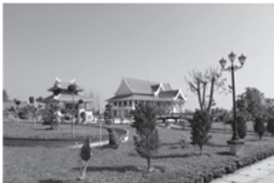
พิพิธภัณฑ์โฮจิมินห์ บ้านเชียงหวาง แขวงคำม่วน

จากอำเภอเมือง จังหวัดนครพนม ลงสู่เขตอำเภอธาตุพนม จังหวัดนครพนม ลักษณะเด่นบริเวณผ่านแม่น้ำเซบั้งไฟของ สปป.ลาว มีถนนหมายเลข 11 ที่สามารถวิ่งได้สะดวก เป็นที่ตั้งของ พิพิธภัณฑ์โฮจิมินห์บ้านเชียงหวาง ซึ่งเป็นแหล่งท่องเที่ยวใหม่ที่ทาง สปป.ลาว ได้รับทุนสนับสนุนจากประเทศเวียดนามในการก่อสร้าง เป็นสถานที่ท่องเที่ยวที่ติดฝั่งแม่น้ำโขง ซึ่งในฝั่งอำเภอธาตุพนม จังหวัดนครพนมก็เป็นสถานที่ตั้งของพระธาตุพนม บริบทสังคมวัฒนธรรมบริเวณนี้จึงมีความหลากหลายทั้งด้านวัฒนธรรม ความเชื่อ รวมถึงประวัติศาสตร์ชาติของไทย-ลาว-เวียดนาม