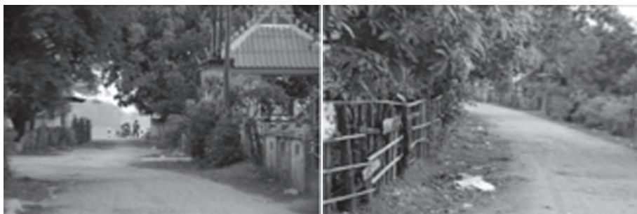
ลักษณะชุมชนบ้านหินปูน สปป.ลาว

จากอำเภอเมือง จังหวัดนครพนม ลงสู่เขตอำเภอธาตุพนม จังหวัดนครพนม ลักษณะเด่นบริเวณผ่านแม่น้ำเซบั้งไฟของ สปป.ลาว มีถนนหมายเลข 11 ที่สามารถวิ่งได้สะดวก เป็นที่ตั้งของ พิพิธภัณฑ์โฮจิมินห์บ้านเชียงหวาง ซึ่งเป็นแหล่งท่องเที่ยวใหม่ที่ทาง สปป.ลาว ได้รับทุนสนับสนุนจากประเทศเวียดนามในการก่อสร้าง เป็นสถานที่ท่องเที่ยวที่ติดฝั่งแม่น้ำโขง ซึ่งในฝั่งอำเภอธาตุพนม จังหวัดนครพนมก็เป็นสถานที่ตั้งของพระธาตุพนม บริบทสังคมวัฒนธรรมบริเวณนี้จึงมีความหลากหลายทั้งด้านวัฒนธรรม ความเชื่อ รวมถึงประวัติศาสตร์ชาติของไทย-ลาว-เวียดนาม