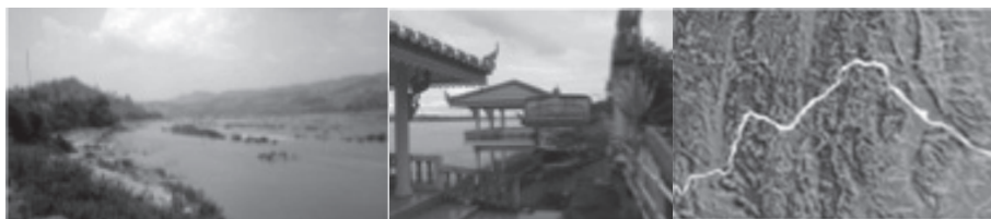
ลักษณะที่ 1 แม่น้ำโขงตอนบน (ที่มา : คณะวิจัย)

ลักษณะที่ 2 แม่น้ำโขงราบเรียบด้วยสายน้ำ ไม่มีเกาะ แก่งดอน ซึ่งจะปรากฏในบริเวณจังหวัดนครพนมและจังหวัดมุกดาหาร การศึกษาพบว่าลักษณะของภูมิศาสตร์แม่น้ำโขงจะสนับสนุนให้เกิดกิจกรรมการท่องเที่ยวทางเรือที่สามารถล่องแม่น้ำโขงชมแหล่งท่องเที่ยวสองฝั่งแม่น้ำโขง เช่น ที่จังหวัดนครพนมจะพบการจัดการท่องเที่ยวทางเรือเพื่อพานักท่องเที่ยวชมแหล่งท่องเที่ยวตามแม่น้ำโขง