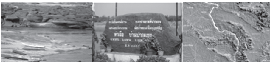
ลักษณะที่ 3 ภูมิประเทศในเขตที่ราบสูง

ลักษณะที่ 3 เป็นแก่งหิน โขดหิน ที่มีลักษณะโดดเด่น แตกต่าง มีสีสัน ซึ่งจะพบภูมิศาสตร์ลักษณะนี้ตั้งแต่พื้นที่อำเภอขานูมาน จังหวัดอำนาจเจริญ ผ่านอำเภอเขมราฐ อำเภอโพธิ์ไทร จนถึงอำเภอโขงเจียม จังหวัดอุบลราชธานี บริเวณนี้เป็นอุปสรรคต่อการล่องเรือระยะยาว ลักษณะภูมิศาสตร์เช่นนี้ทำให้เกิดการท่องเที่ยวตามแม่น้ำโขง ที่ใช้ความงามของแก่ง โขดหิน เช่น แหล่งท่องเที่ยวหาดสลึง แหล่งท่องเที่ยวสามพันโบก รวมทั้งแหล่งท่องเที่ยวแม่น้ำสองสีที่อำเภอโขงเจียม