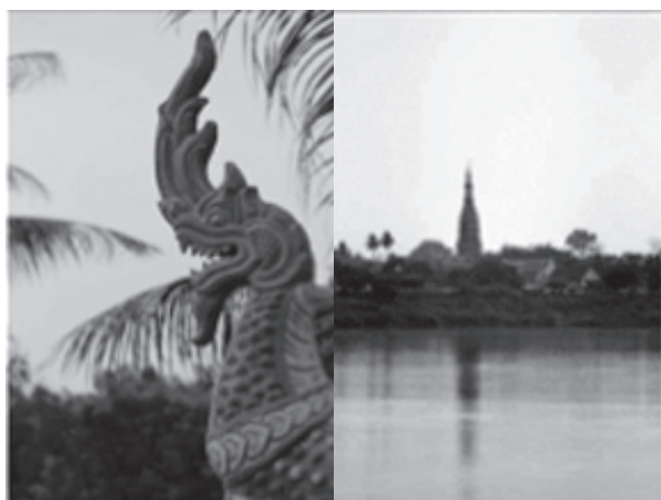
วัฒนธรรมความเชื่อเรื่อง พระธาตุกับพญานาคของ คนสองฝั่งโขง

วิถีชีวิตของคนสองฝั่งโขงบริเวณด้านหิโนนนี้ ยังคงมีวิถีชีวิตสัมพันธ์กับแม่น้ำโขง ตั้งแต่การคมนาคมที่ต้องใช้เรือข้ามฟาก ซึ่งเป็นเรือขนาดเล็กมีคนนั่งไม่เกิน 7 คน มีเครื่องยนต์ติดที่ท้ายเรือใช้เวลาล่องข้ามไม่เกิน 30 นาที ชาวลาวจะเดินทางไปตัวเปล่า แต่เมื่อกลับมาต่างมีสินค้าบรรทุกมาเต็มเรือ สิ่งเหล่านี้สะท้อนวิถีการพึ่งพาระหว่างคนสองฝั่งบริเวณดังกล่าวนี้ได้เป็นอย่างดี นอกจากนี้ยังคงมีการใช้ประโยชน์จากแม่น้ำโขงเป็นที่เล่นน้ำ เป็นแหล่งหาปลา เด็กๆชาวลาวยึดเบ็ดตกปลาแบบดั้งเดิมคือ เป็นเหล็กที่ทำจากไม้ไฟหลายอย่างดี มีเชือกมัดหมากเบ็ดไว้ ซึ่งหากมองในมิติด้านการท่องเที่ยวแล้ว วิถีดั้งเดิมของชาวลาวดังกล่าวนี้คือเสน่ห์ของลาวที่เข่าใช้ผูกมัดใจนักท่องเที่ยวมาโดยตลอด