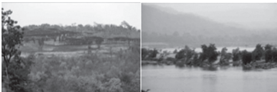
ผาแต้มและแม่น้ำสองสี ที่โขงเจียม

สุดท้ายของเส้นทางท่องเที่ยวแบบ cross-border tourism ที่เทศบาลเมืองโขงเจียม สุดท้ายของแม่น้ำโขง ที่อดีตที่ตั้งชุมชนจะอยู่ห่างจากแม่น้ำโขง แต่เมื่อมีการขยายตัวของเมือง โดยเฉพาะส่วนราชการ และการประชาสัมพันธ์ลักษณะแม่น้ำสองสีที่โขงเจียม ตะวันขึ้นที่โขงเจียม รวมถึงอุทยานแห่งชาติผาแต้ม ทำให้อำเภอโขงเจียม กลายเป็นที่ท่องเที่ยวที่โดดเด่น ทั้งที่มีลักษณะภูมิศาสตร์ปิดด้วยแม่น้ำโขง กล่าวคือเป็นจุดสิ้นสุดแม่น้ำโขงที่บ้านเวินบึก อีกทั้งเป็นเขตพื้นที่ทางผ่านหากเดินทางเพื่อจะไปแขวงจำปาสัก ไม่มีความจำเป็นต้องเดินทางมายังโขงเจียม แต่อย่างไรก็ตาม โขงเจียมมีลักษณะเด่นด้านการท่องเที่ยวดังกล่าว