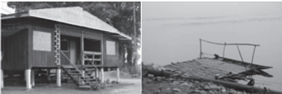
ด่านหินบูนและท่าเรือใน สปป.ลาว