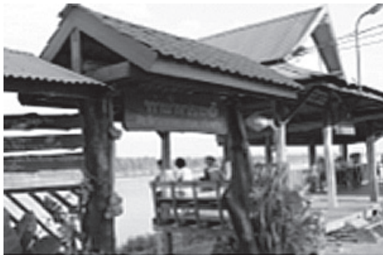
ด่านประเพณีฝั่งไทย จังหวัดอำนาจเจริญ