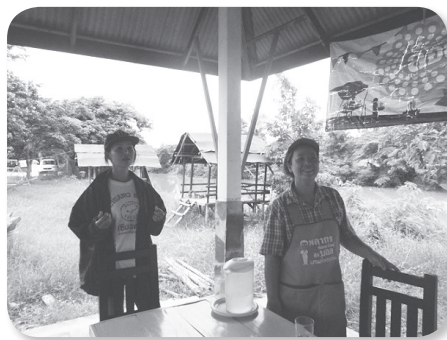
❖ ชาวบ้านชุมชนชอยน้ำทิพย์ อาศัยอยู่ริมฝั่งแม่น้ำปาว

ปัจจัยที่ส่งผลต่อการขยายตัวของชุมชนในเขตเทศบาลเมืองกาฬสินธุ์ ในช่วงระหว่างปี พ.ศ. 2480 - 2525 คือ ปัจจัยที่เกิดจากนโยบายของทางราชการและเทศบาลเมืองกาฬสินธุ์ ได้แก่ การก่อสร้างเส้นทางคมนาคม การขยายการบริการด้านสาธารณสุข รองลงมา ได้แก่ การเพิ่มขึ้นของจำนวนประชากร ซึ่งส่งผลให้ที่อยู่อาศัยต่างๆ เพิ่มจำนวนขึ้นตามไปด้วย ส่วนปัจจัยสุดท้าย คือ การเปลี่ยนแปลงทางด้านเศรษฐกิจสังคม มีผลต่อการขยายชุมชนน้อยกว่าปัจจัยอื่น เนื่องจากชุมชนเมืองกาฬสินธุ์ยังอยู่ใต้อิทธิพลทางด้านเศรษฐกิจของเมืองใหญ่ที่อยู่ใกล้เคียง เช่น จังหวัดขอนแก่น จังหวัดอุดรธานี ทำให้เศรษฐกิจของชุมชนขยายตัว หรือเติบโตขึ้นอย่างช้าๆ เมื่อเทียบกับชุมชนใกล้เคียง เช่น จังหวัดร้อยเอ็ด จังหวัดมหาสารคาม เป็นต้น