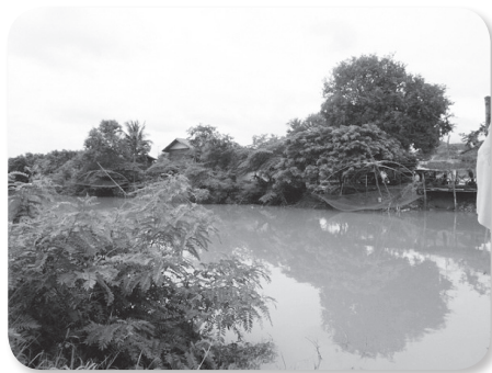
❖ ชุมชนชอยน้ำทิพย์ ริมฝั่งแม่น้ำปาว

ว่างที่มีอยู่ในชุมชน การขยายตัวของชุมชนไปยังบริเวณอื่นมีน้อยมาก ส่วนหนึ่งจะออกไปอาศัยอยู่ในพื้นที่ไร่นาในช่วงระยะเวลาที่ทำการเกษตร อย่างไรก็ตามการไปอาศัยอยู่ตามไร่นาในบางฤดูกาลที่ทำการเกษตรส่งผลให้บริเวณดังกล่าวกลายเป็นชุมชนใหญ่ในเวลาต่อมา