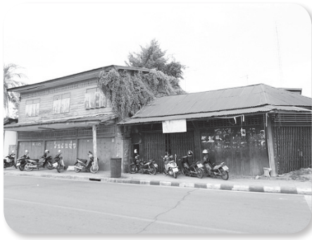
❖ บ้านเก่าริมถนนโสมพะมิตร ชุมชนวัดเหนือ

นอกจากนี้ชุมชนดั้งเดิมอีกรุ่นหนึ่งจะอยู่บริเวณรอบๆ แหล่งน้ำธรรมชาติคือ ชุมชนซอยน้ำทิพย์ ชุมชนท่าสินค้า ชุมชนหนองไขหวาน ชุมชนหนองผักแว่น ชุมชนแก่งดอนกลาง แต่ละชุมชนมีประวัติความเป็นมา และเรื่องเล่าของการมาตั้งชุมชน ซึ่งได้รับฟังมาจากบรรพบุรุษเล่าต่อๆ กันมาเช่น นางบัวแก้ว ภูครองเชิง อายุ 58 ปี บ้านเลขที่ 539/1 ถนนอนรรฆนาค ชุมชนแก่งดอนกลาง ได้เล่าถึงประวัติชุมชน “เจ้าโสมพะมิตร ได้มาตั้งถิ่นฐานบ้านเรือนอยู่บริเวณริมแม่น้ำลำปาว เดิมชื่อว่าคุ่มแก่งสำโรง ที่ตั้งของเมืองกาฬสินธุ์ เดิม แต่ต่อมาไม่นานก็ย้ายถิ่นฐานกันออกไปบางส่วนเพราะเกิดน้ำท่วมพื้นที่ บางกลุ่มก็ยังอาศัยอยู่ที่เดิมแต่ทำนาก็แตกตั้งคนดูแลเรื่อยมา มีคุณพ่ออาน โปธิแทน ได้อพยพย้ายถิ่นฐานมาจากโคราช มาตั้งบ้านเรือนอยู่ที่บ้านแก่งสำโรงนี้ ชักชวนคนมาอาศัยเพิ่มมากขึ้น ต่อมาเปลี่ยนชื่อจากคุ่มแก่งสำโรง เป็นแก่งดอนกลาง เนื่องจากบริเวณนี้เป็นแก่งน้ำ และมีพื้นที่ดอนอยู่ตรงกลางจึงเรียกว่าชุมชนแก่งดอนกลาง”