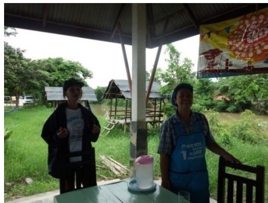
ชุมชนซอยน้ำทิพย์ ริมฝั่งแม่น้ำปาว